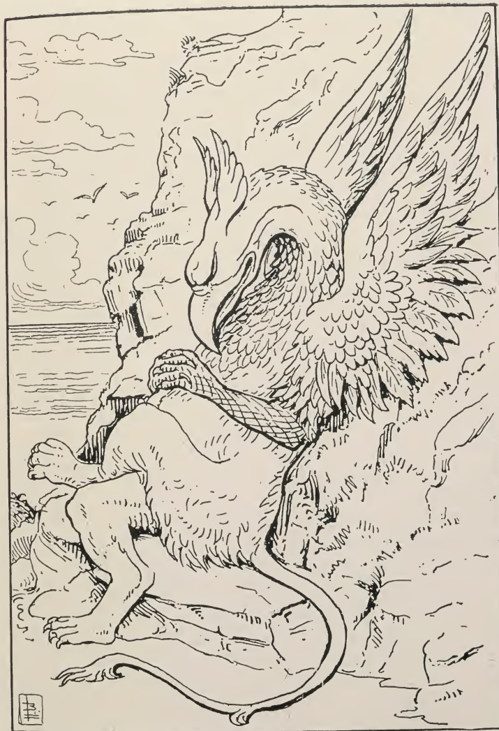
LA GRIFO PROFUNDE DORMIS.

“Ho, ĝin diru al mi, mi petas” Alicio diris.